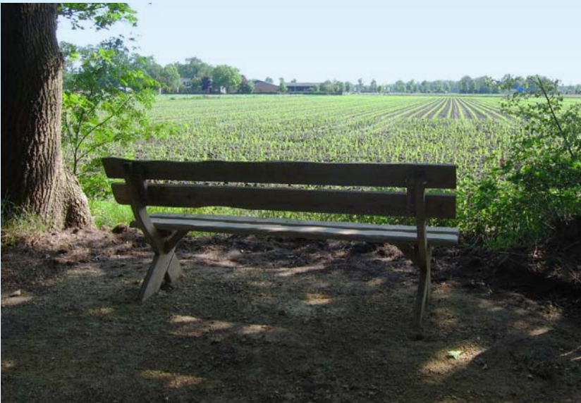
Lamberts bospad: bankje met uitzicht over de akkers